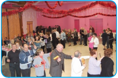
Configuration repas & soirée dansante.