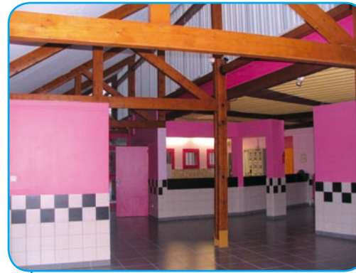
Hall d'entrée avec son bar.